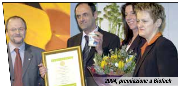
2004, premiazione a Biofach