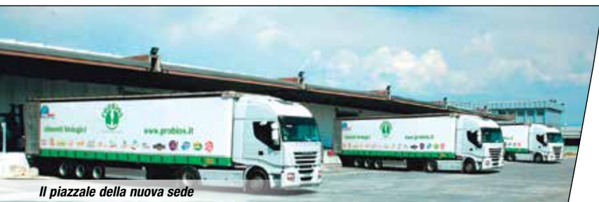
Il piazzale della nuova sede