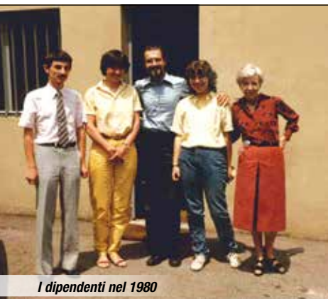
I dipendenti nel 1980