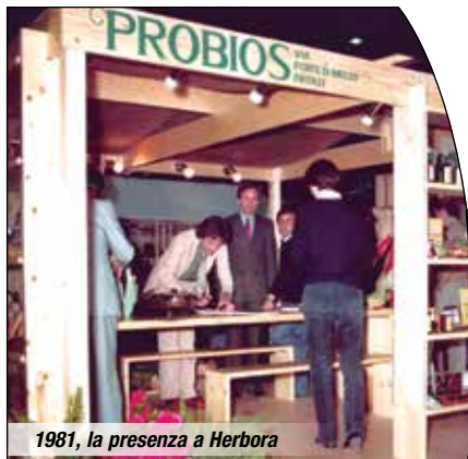
1981, la presenza a Herboria