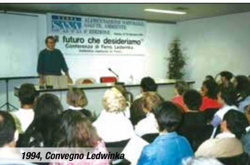
1994, Convegno Ledwinka