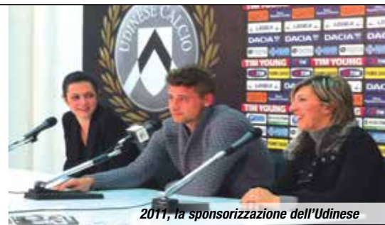
2011, la sponsorizzazione dell'Udinese