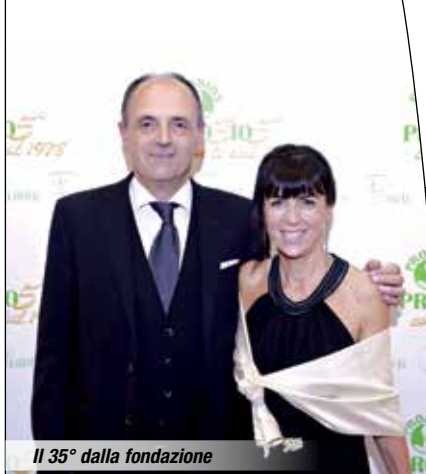
Il 35° dalla fondazione