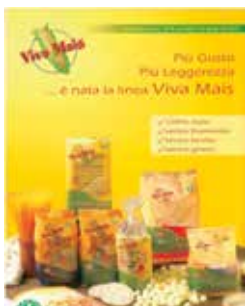
Alcuni degli apprezzatissimi prodotti Probios