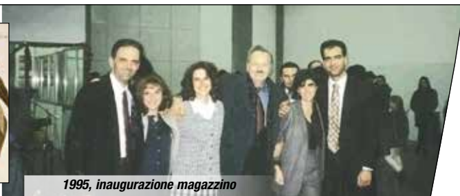
1995, inaugurazione magazzino