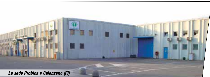
La sede Probios a Calenzano (FI)