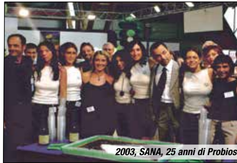
2003, SANA, 25 anni di Probios