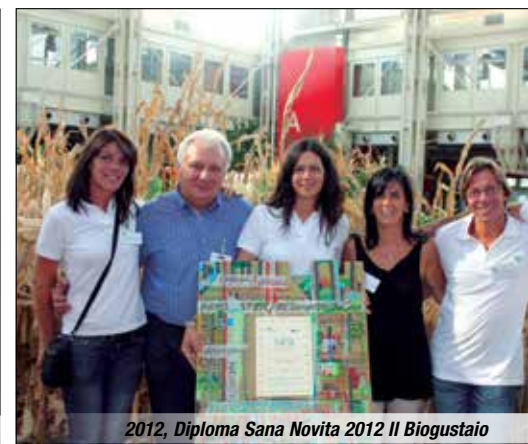
2012, Diploma Sana Novita 2012 Il Biogustaio