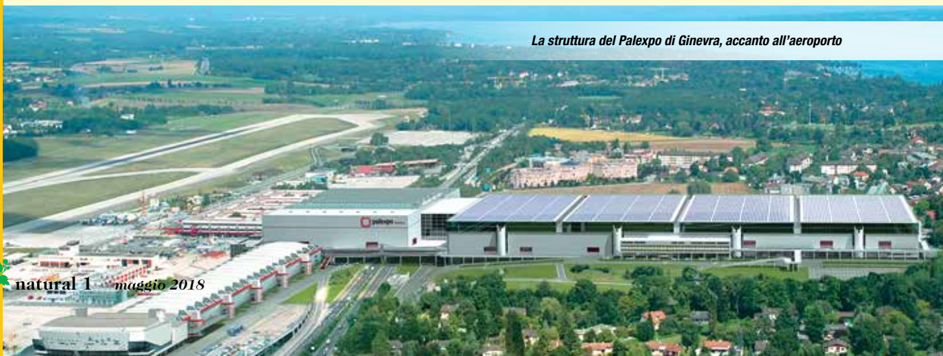
La struttura del Palexpo di Ginevra, accanto all'aeroporto