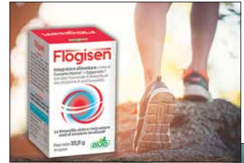
L'integratore Flogisen, le materie prime e una fase della lavorazione

La nostra storia è iniziata con la fitoterapia e i nostri studi continuano anche sulle formulazioni a base di piante officinali, per offrire integratori al passo con i tempi. L'ultimo fra i prodotti arrivati è Flogisen, un integratore a base di curcuma meriva® (formulazione più potente in commercio di Curcuma longa , 29 volte più biodisponibile rispetto ad una curcuma non fitosomata), casperome® (un estratto fitosomato della Boswellia ) e Zenzero,