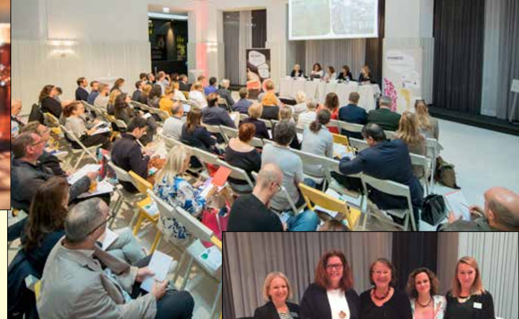
Alcune immagini della conferenza stampa che si è svolta a Vienna e di uno degli incontri dei giornalisti di settore con i professionisti del naturale e biologico austriaci

sarà toccato un altro tema di grande attualità. Nelle conferenze e nei numerosi altri format allestiti per questo nuovo evento speciale, che avrà sede nel padiglione 8, numerose associazioni, istituzioni e aziende presenteranno progetti e prodotti che riguardano l'acqua come risorsa vitale. Appuntamento l'anno prossimo a Norimberga.