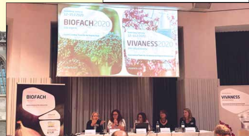
Foto di gruppo per i giornalisti delle riviste specializzate internazionali invitati alla conferenza stampa di Biofach e Vivaness a Vienna