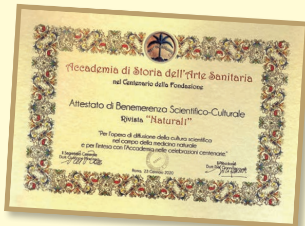
L'attestato rilasciato alla testata Natural 1

"Mi è gradito inviare la nota, dal titolo "Passato e presente all'Accademia di Storia dell'Arte Sanitaria" , pubblicata da Natural 1, Maggio 2020, N° 192, 68-78, relativa alla celebrazione del 100° A.A. in data 23 gennaio 2020. La redazione di Natural 1, nonostante le criticità e limitazioni dettate dalla pandemia in atto, non è venuta e non viene meno al proprio ruolo e impegno nell'assicurare la continuità della pubblicazione mensile della Rivista. Infatti, l'ufficio sta lavorando in modalità smart working, superando passaggi all'interno della redazione che sono complicati e rallentati dalla diversa organizzazione del lavoro.