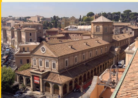
La sede dell'Accademia