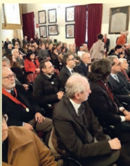
Il pubblico presente durante la cerimonia celebrativa