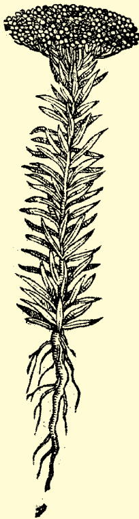
Immagine tratta dal volume "Mattioli"