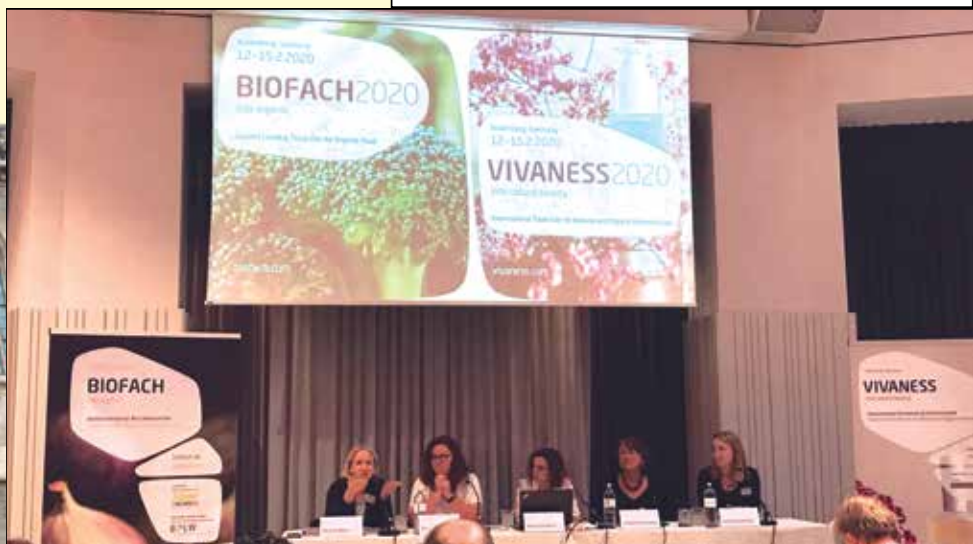
Foto di gruppo per i giornalisti delle riviste specializzate internazionali invitati alla conferenza stampa di Biofach e Vivaness a Vienna