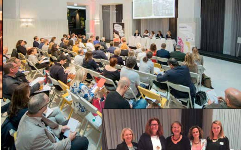
Alcune immagini della conferenza stampa che si è svolta a Vienna e di uno degli incontri dei giornalisti di settore con i professionisti del naturale e biologico austriaci

sarà toccato un altro tema di grande attualità. Nelle conferenze e nei numerosi altri format allestiti per questo nuovo evento speciale, che avrà sede nel padiglione 8, numerose associazioni, istituzioni e aziende presenteranno progetti e prodotti che riguardano l'acqua come risorsa vitale.