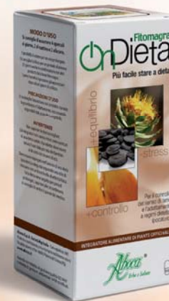
Flacone da 100 opercoli

Ondieta interviene sul senso di fame e sullo stress , aiutando i processi fisiologici legati al metabolismo dei grassi.