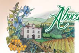
L'EVOLUZIONE DELLA FITOTERAPIA

Il prodotto non sostituisce una dieta variata. Seguire un regime alimentare ipocalorico e una regolare attività fisica. In caso di dieta seguita per periodi prolungati, oltre le tre settimane, si consiglia di consultare il medico. Leggere attentamente le avvertenze.