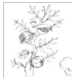
La pianta del melograno e il suo frutto sono nella mitologia collegate a divinità che simboleggiano la fecondità e la vita; la melograna tenuta in mano da Giunone era simbolo del matrimonio.