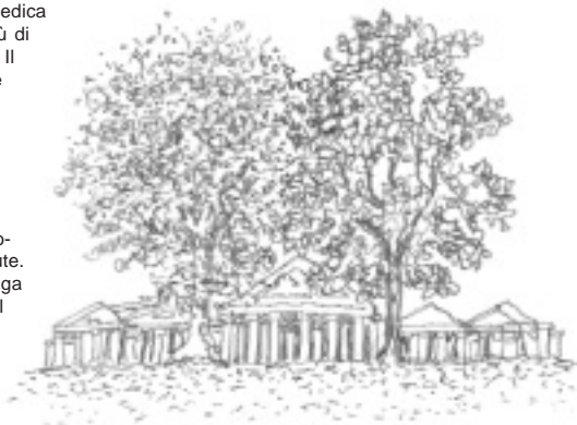
Tiglio prodigioso lasciato dagli dei ai mortali perché se ne servissero quale mezzo per ottenere quiete e serenità, farmaco rassicurante capace di procurare all'uomo una lunga vita

mentose, il serpente che rappresenta il rinnovamento e il gallo. Lo stesso Socrate prima di morire pregò che si sacrificasse ad Asclepio un gallo, simbolo del giorno e della vita che rinasce. E se Ippocrate, ultimo rampollo della famiglia degli Asclepiadi, ci ricorda che ogni buon medico deve avvalersi "del regime di vita per aiutare i malati secondo le sue forze e il suo giudizio, astenendosi dal recar danno e ingiustizia. Non somministrando ad alcuno, neppure se richiesto, un farmaco mortale..." bisognerà riappropriarsi, con rispetto e gratitudine, del Phàrmakon degli dei, degli innumerevoli medicamenti dalla natura che consentono all'uomo che li pratica di guarire gli altri uomini.