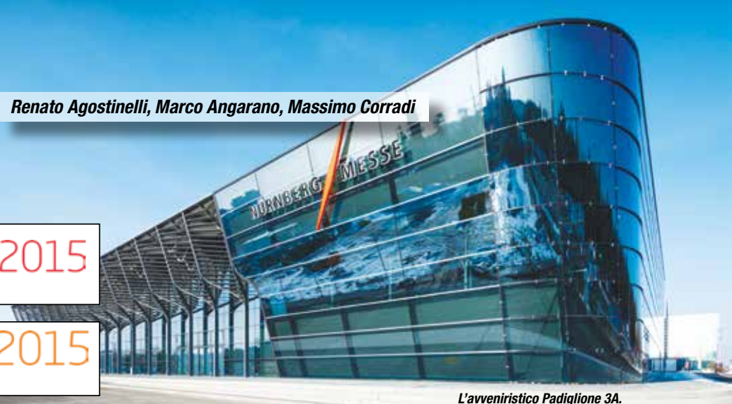
L'avveniristico Padiglione 3A.