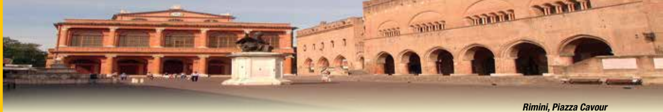
Rimini, Piazza Cavour