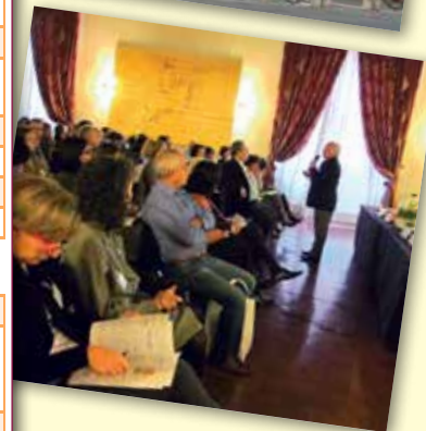
Dall'alto: Il Duomo di Terni; un momento del I Congresso SIROE del 2013