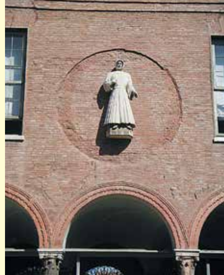
La statua che campeggia sopra il cortile della Facoltà di Farmacia dell'Università di Ferrara

Il Congresso Nazionale si pone come momento di incontro per rafforzare e consolidare rapporti di stima, amicizia, cooperazione tra tutti i soci dell'Accademia Italiana di Storia della Farmacia.