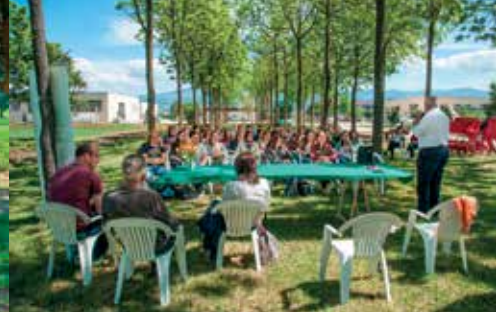
Alcuni momenti in cui si sono articolate le iniziative di Laboratori Biokyma