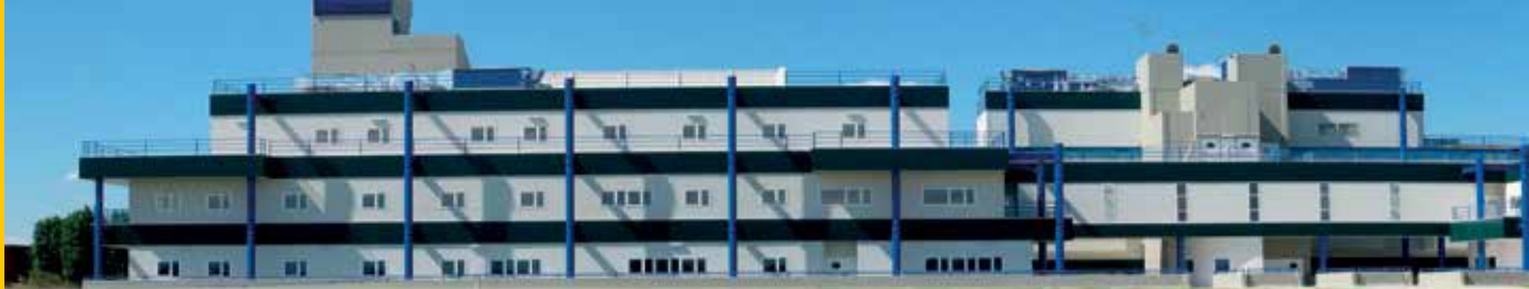
Palazzo Botta 2, polo nuovo e moderno dell'Università di Pavia