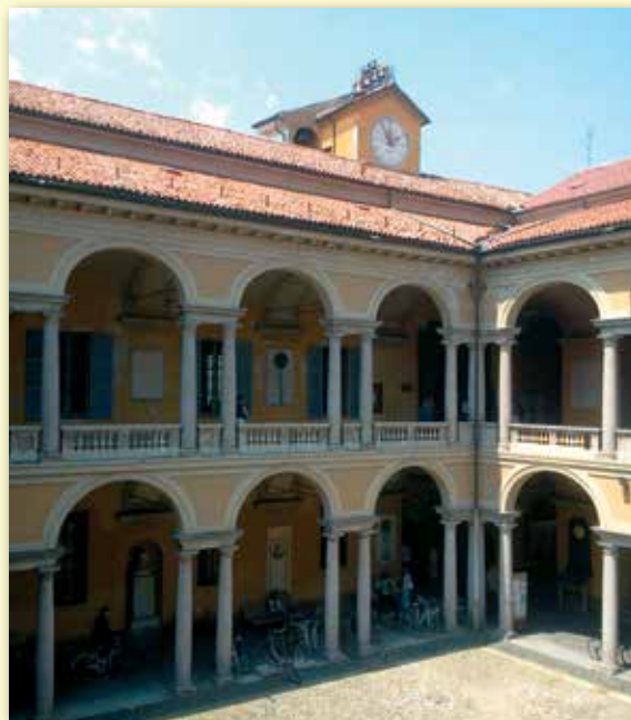
Il cortile dell'Università di Pavia