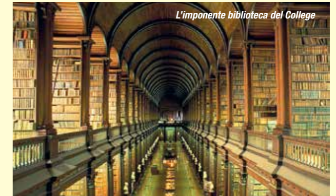
L'imponente biblioteca del College