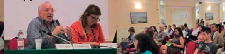
Nelle immagini di queste due pagine alcuni momenti e attività del congresso