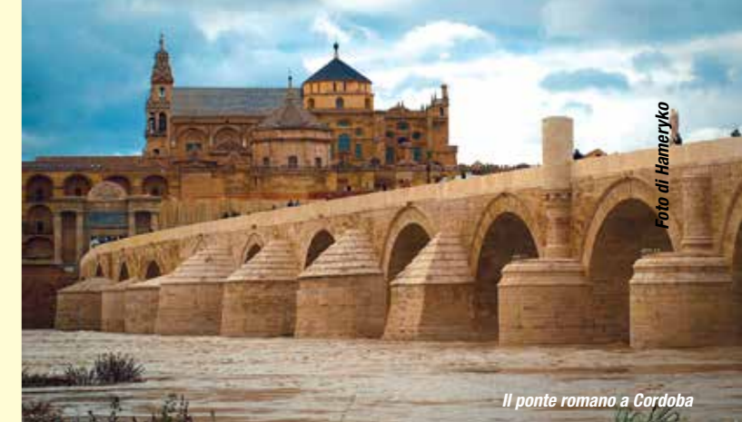
Il ponte romano a Cordoba

But among all of them, 2014 will provide two singular opportunities and messages: Family farming, urban and suburban vegetable gardens, and agrobiodiversity exchange through farmers networks. The UN has declared 2014 as the International Year of Family Farming. Cooking and traditional food habits as a source of knowledge for agricultural innovation and tool in the fight against hunger and health deficit in the world. Córdoba (Spain) will be Iberoamerican Capital of Gastronomic Culture 2014