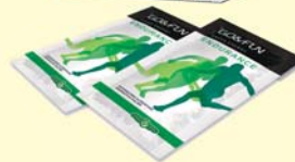
Go&Fun Endurance, uno dei prodotti della nuova linea presentata da Erba Vita