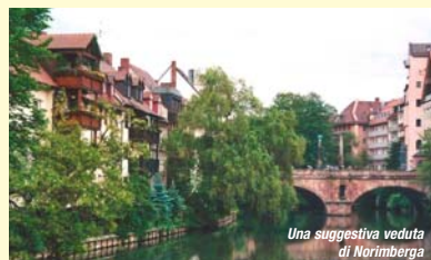
Una suggestiva veduta di Norimberga

Website: www.biofach.de/en - www.vivanness.de/en