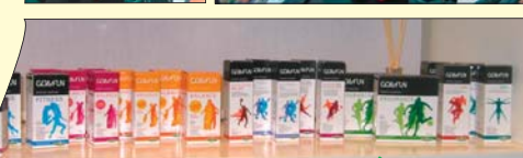
Nelle immagini a fianco, alcuni momenti della presentazione Erba Vita