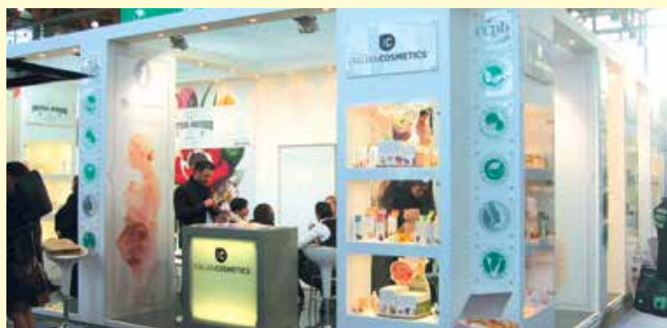
Alcuni momenti dell'edizione 2016