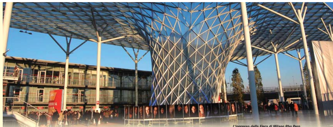
L'ingresso della Fiera di Milano Rho Pero