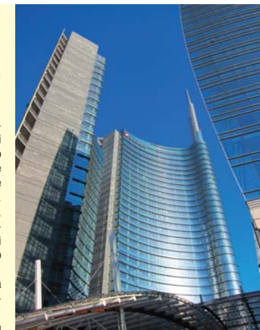
Il nuovo quartiere di Milano Porta Nuova