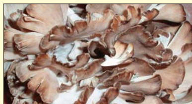
Esemplare di maitake ( Grifola frondosa )