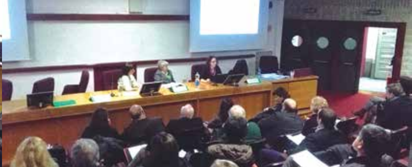
Il pubblico e alcuni dei relatori in due momenti dell'evento

e di principi attivi vegetali nei confronti di un ceppo clinico di Mycobacterium abscessus multi-resistente e produttore di biofilm” e su “Effetti di concentrazioni subletali di olio essenziale di Origanum vulgare sull’attività enzimatica di funghi di interesse alimentare”. Il titolo è stato completato da un piccolo premio economico gentilmente offerto dalle Aziende che hanno sostenuto l’evento, in particolare il primo premio è stato concesso dalla società Flora srl mentre i secondi ex-aequo dalle società Apa-CT srl e Exentiae srl.