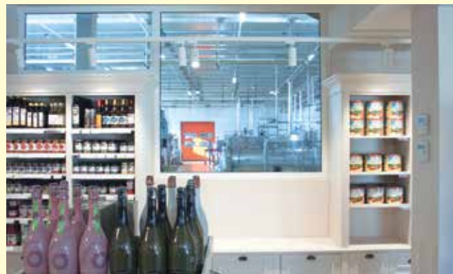
La "finestra" che dallo shop si affaccia direttamente sul laboratorio di produzione