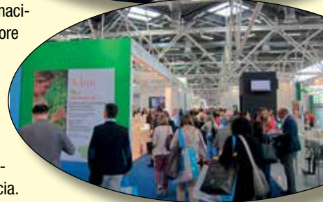
Alcuni momenti tra i padiglioni della fiera