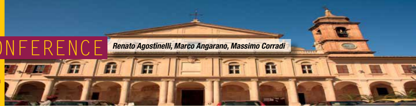
Il Duomo di Terni