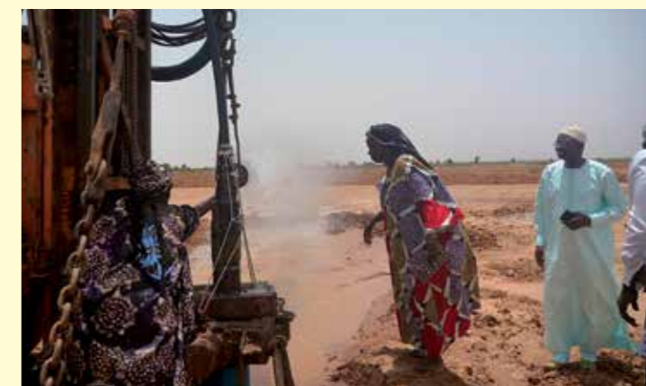
Nell'immagine, il momento in cui dalle pompe ha cominciato a fuoriuscire l'acqua, trovata a 45 metri di profondità