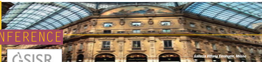
Galleria Vittorio Emanuele, Milano

GSISR Gruppo Scientifico Italiano Studi e Ricerche