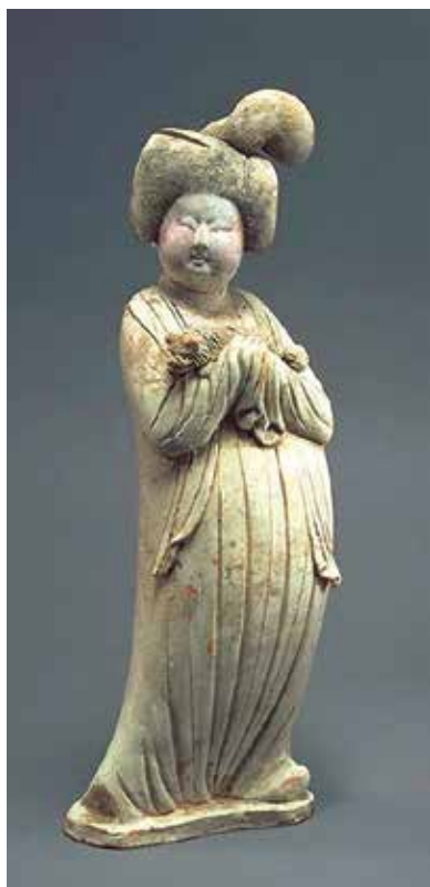
Fig. 3 Dama con Pechinese (Kyoto National Museum) https://www.kyohaku.go.jp/eng/dictio/touji/kasai.html

donne sono raffigurate con profili voluttuosi, con lunghi capelli raccolti, con sopracciglia ad ali di farfalla e con bocche piccole e rosse come ciliegie (FIG 3).