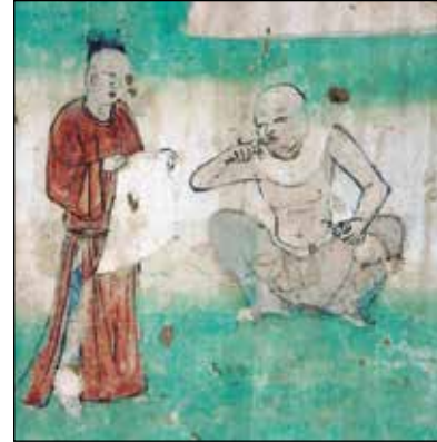
Fig. 8 - I dentifrici: particolare della grotta 159 del complesso di Mogao, Dunhuang, Gansu https://www.buddhism.hku.hk/undergraduate/CCCH9044/leaflet.pdf