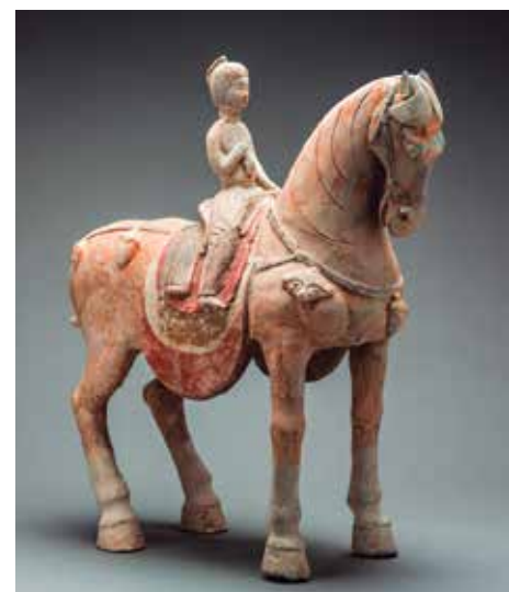
Fig. 2 - Dama a Cavallo (Barakat Gallery) http://store.barakatgallery.com/product/tang-painted-terracotta-sculpture-of-a-horse-and-female-rider/

una forte influenza sul modo di concepire la bellezza femminile. Gli ornamenti e costumi delle culture centro asiatiche sono introdotte nella moda femminile cinese, come testimoniato dall'uso del buyao , un ornamento per i capelli, realizzato in materiali nobili come l'oro e l'argento, ma anche in giada e agata, decorato con pietre preziose e ciondoli (FIG 1) (1) . Per capire al meglio la moda femminile del periodo, si possono considerare le statuette fittili di figure femminili, solitamente accompagnate da piccoli animali da cortile o mentre suonano strumenti musicali. Queste statuette sono prodotte durante tutto il periodo Tang e testimoniano come muta il concetto di bellezza. La produzione tra il VII e l'VIII secolo si caratterizza per le figure esili, dal profilo sottile e sinuoso (FIG 2). Dall'VIII secolo in poi, le