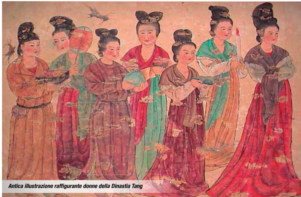
Antica illustrazione raffigurante donne della Dinastia Tang

di origine animale (la cera d'api e i grassi animali) e minerali (come il talco e la steatite) in acqua, che assolvono alle medesime funzioni delle saponine. In generale tali ingredienti "attivi" sono utilizzati simultaneamente con materiali di base con differenti proprietà, come le farine, al fine di creare prodotti con diverse consistenze, variamente aromatizzati con sostanze odorose, essenze per migliorarne le caratteristiche organolettiche. Per esempio in