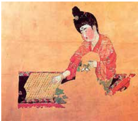
Fig. 4 Ladies-in-Waiting at the Go Board (Yiqi Shinyü tu). Museum of Xinjiang Uyghur Autonomous Region (Urumqi); (Cho, 2012), p. 27, https://commons.wikimedia.org/wiki/File:Beauty_playing_Go_(Tang_Dynasty).jpg

La forma dell' huadian è varia e comprende soluzioni decorative molto semplici e stilizzate fino a disegni complessi, e può essere dipinto direttamente sulla fronte, può essere realizzato con materiali vari (quali carta, seta, madreperla, petali di fiore, piume d'uccello ecc.) e può essere applicato su uno strato di cipria di colore giallo (9) (FIG 4 e 5).