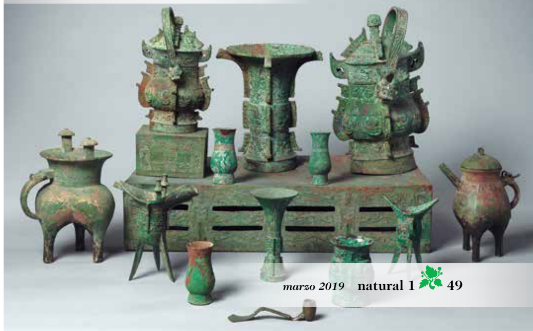
Oggetti in bronzo Dinastia Shang (Metropolitan Museum of Art)