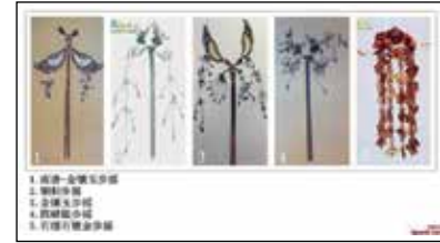
Fig. 1 - Esempio di Buyao

una forte influenza sul modo di concepire la bellezza femminile. Gli ornamenti e costumi delle culture centro asiatiche sono introdotte nella moda femminile cinese, come testimoniato dall'uso del buyao , un ornamento per i capelli, realizzato in materiali nobili come l'oro e l'argento, ma anche in giada e agata, decorato con pietre preziose e ciondoli (FIG 1) (1) . Per capire al meglio la moda femminile del periodo, si possono considerare le statuette fittili di figure femminili, solitamente accompagnate da piccoli animali da cortile o mentre suonano strumenti musicali. Queste statuette sono prodotte durante tutto il periodo Tang e testimoniano come muta il concetto di bellezza. La produzione tra il VII e l'VIII secolo si caratterizza per le figure esili, dal profilo sottile e sinuoso (FIG 2). Dall'VIII secolo in poi, le