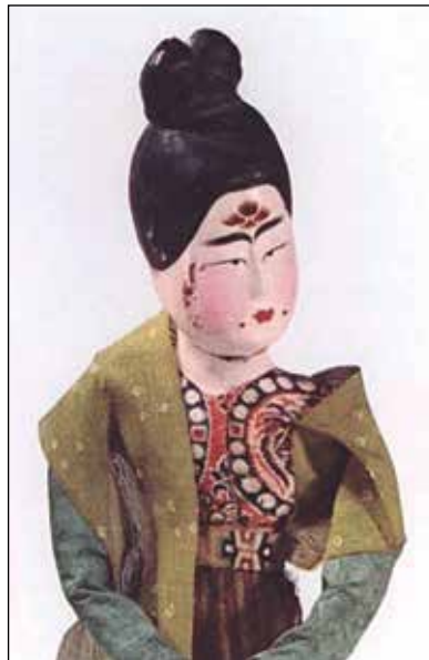
Fig. 5 Statuetta lignea di dama di period Tang, con vesti in seta e carta, proveniente dalla sepoltura di Zhang Xiong, Turfan, Xinjiang Uyghur Autonomous Region (WATT & HARPER, 2004, P. 288-9)

Solitamente le donne cinesi ricorrono la superficie delle labbra con la cipria bianca e disegnano al di sopra di essa l'area su cui si applica il balsamo/rossetto, creando dei motivi decorativi stilizzati ispirati alla natura, che variano in base alla moda in voga. Dal VIII secolo per esempio è particolarmente popolare la forma di una ciliegia, rendendo così l'effetto di labbra piccole, carnose e rosse (7) (FIG 6).