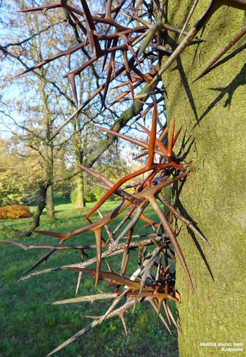
Gleditsia sinensis , fonte di saponine