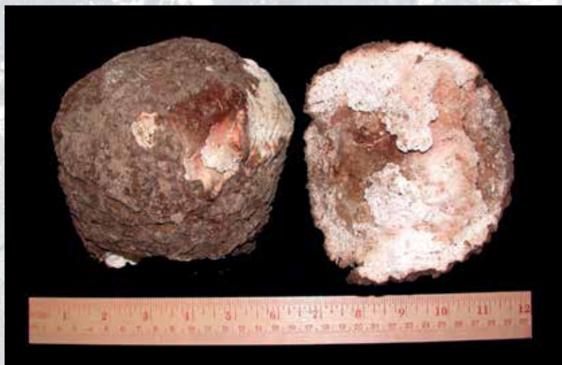
Lo sclerozio di Wolfiporia ha una forma irregolare e dimensioni variabili, arrivando a pesare anche oltre 10 chilogrammi; si ritrova sepolto nei boschi sotto strati di aghi di pino o nel terreno

Sotto strati di aghi di pino o sepolto nel terreno, aderente alle radici di taluni alberi, si può rinvenire una sorta di palla bruna, con una scorza fittamente ricoperta da piccoli pori. Si tratta dello sclerozio di un fungo appartenente alla famiglia delle Polyporaceae con una storia antica di utilizzo da parte dell'uomo. Elemento importante della farmacopea di numerose medicine tradizionali asiatiche, dal Pacifico al Tibet, viene denominato Fu ling in Cina, Bukuryou o Matsuhodo in Giappone e Bokryun in Corea. Le prime descrizioni in occidente risalgono probabilmente al XVIII secolo. Il botanico olandese Ru-