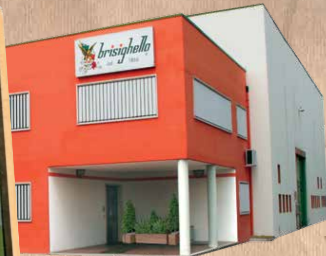
La moderna sede dell'Azienda, sulla facciata della quale campeggia il logo storico