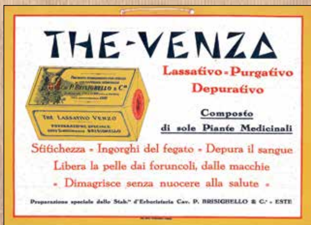
Pubblicità del The Venzo, primi del '900

Nei primi anni del '900 ormai due terzi della popolazione rurale di Solesino si dedicava alla raccolta e alla lavorazione di erbe contribuendo a un vero e proprio benessere economico che giovò a tutto il territorio, allentando lo spettro della disoccupazione e della fame.