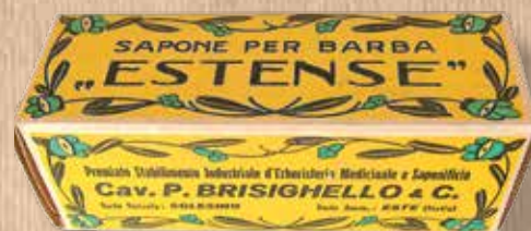
Confezione originale d'epoca del Sapone da Barba Estense, uno dei prodotti "storici" di maggior successo