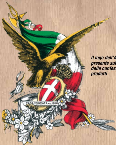
Il logo dell'Azienda, presente sulle molte delle confezioni dei prodotti

Q uesto testo, apparso su una pubblicazione del 1910, attesta senza equivoci la nascita della premiata Pietro Brisighello & Co. in Solesino, la più antica azienda di prodotti erboristici, ancora presente sul mercato italiano.