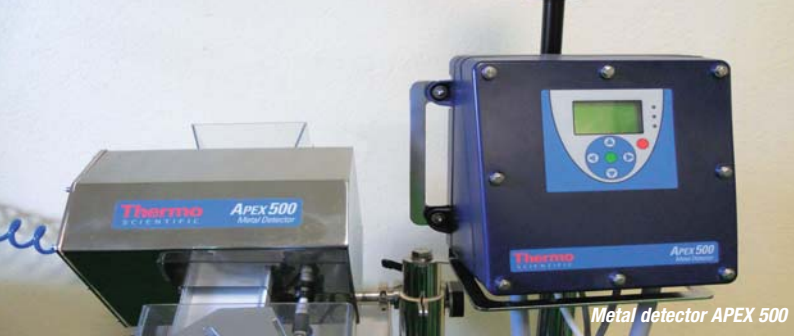
Metal detector APEX 500