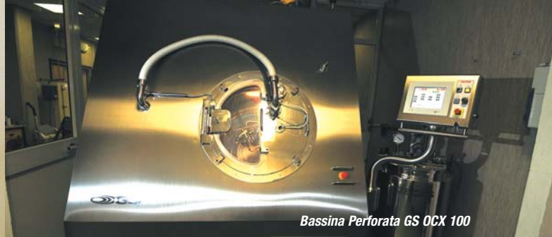
Bassina Perforata GS OCX 100