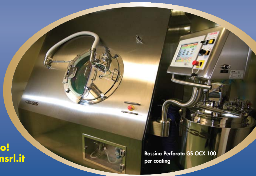
Bassina Perforata GS OCX 100 per coating