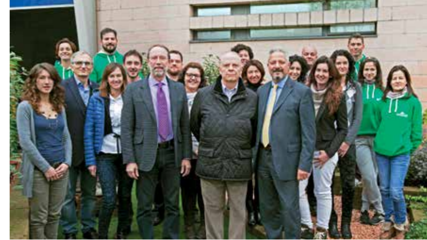
L'affiatato staff di Naturando al completo

E in tema di anniversari Zonato apre una parentesi personale: