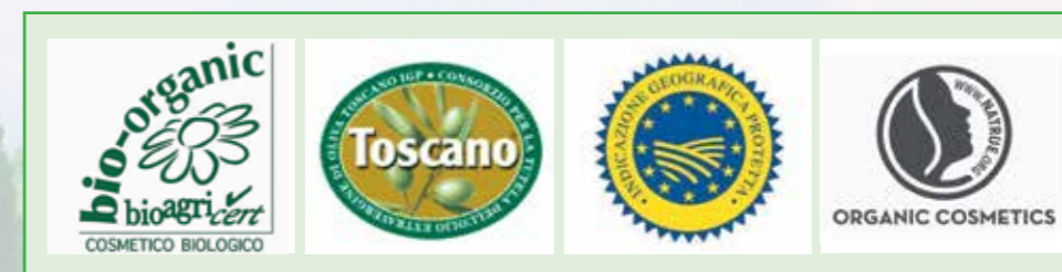
Le certificazioni di qualità ottenute dalla Linea Prima Spremitura