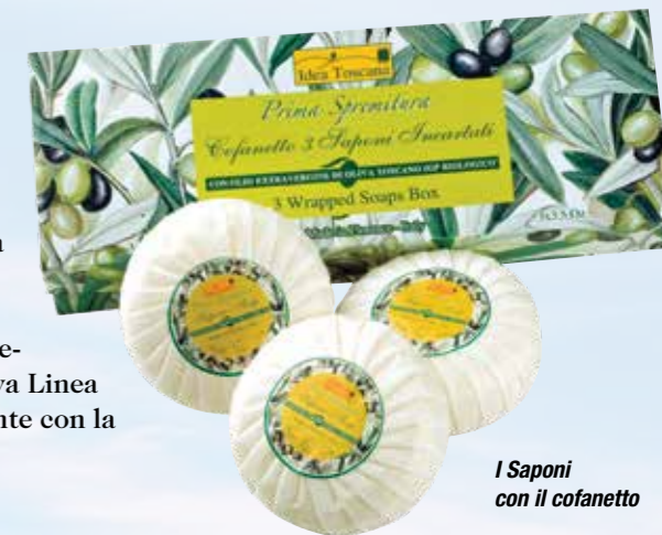
I Saponi con il cofanetto

I prodotti sono realizzati con Olio Extravergine di Oliva "Toscano IGP" proveniente da Agricoltura Biologica.