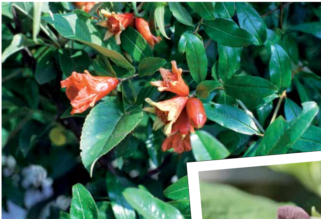
Nightly she sings on you pomegranate tree. "Romeo & Juliet" III.v. Punica granatum