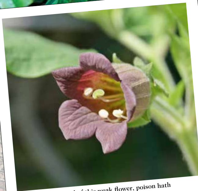
Within the infant rid of this weak flower, poison hath residence, and medicine power "Romeo & Juliet" II.iii Atropa belladonna