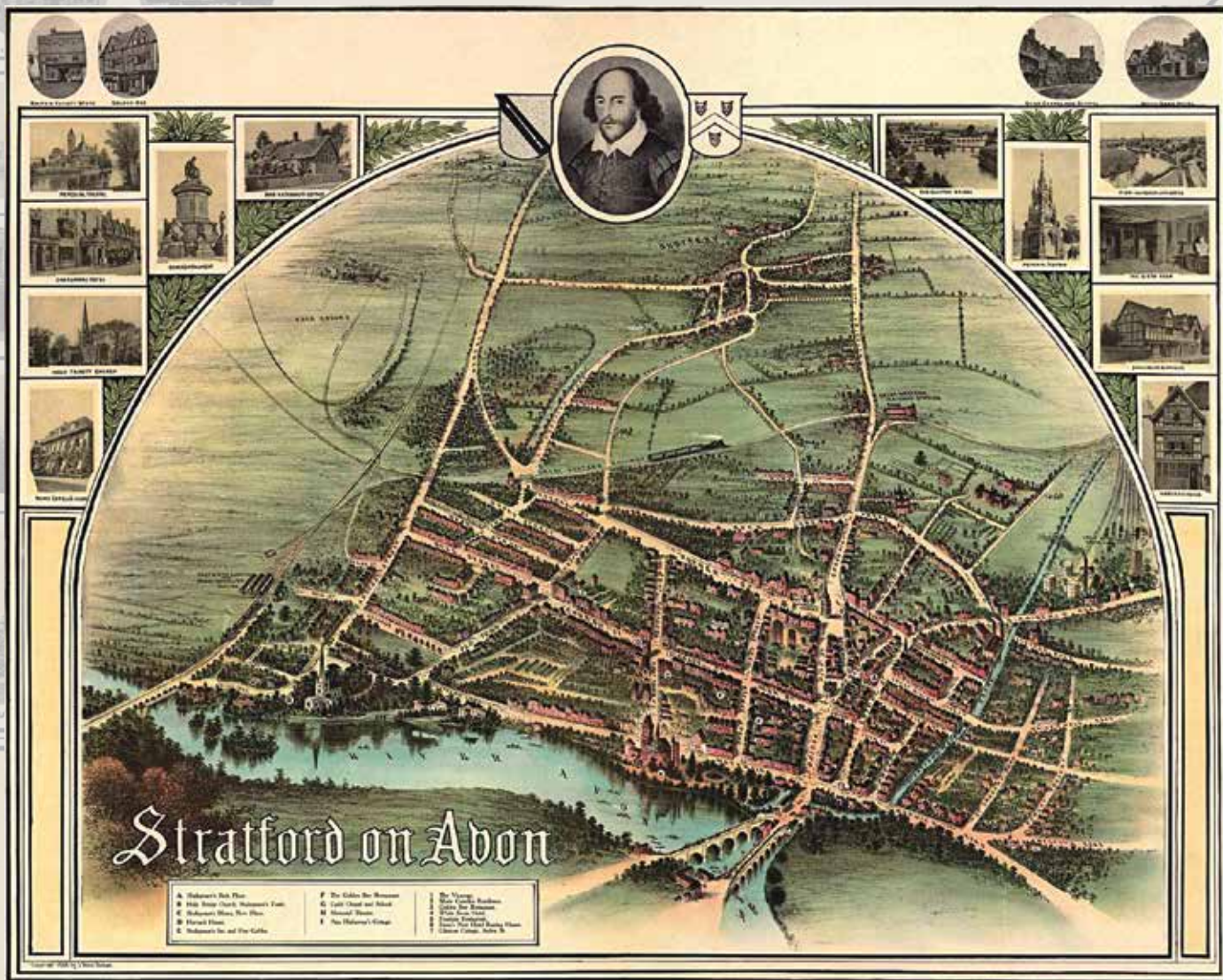
Sopra, Stratford-upon-Avon, città natale del drammaturgo, in una cartina del 1902. Sotto, la Cattedrale del paese, oggi