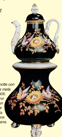
Lume da notte con tisaniere della metà del sec. XIX. Oggetto che serviva per dare un tenue chiarore alla camera da letto e per tenere tiepida la tisana.

AB DDR Farmacopea della Repubblica Democratica Tedesca 1983 BGA Ministero della Sanità Tedesco (ora BfArM) BHP British Herbal Pharmacopeia DAB Farmacopea Tedesca DAC Codex della Farmacopea Tedesca EB6 Supplemento alla Farmacopea Tedesca 6 ESCOP European Scientific Cooperative on Phytotherapy FF Farmacopea Francese FU Farmacopea Italiana Kom. E Commissione di Fitoterapia del Ministero della Sanità Tedesco OeAB Farmacopea Austriaca OMS Organizzazione Mondiale della Sanità (anche WHO) PDR Physician's Desk Reference for Herbal Medicines della Medical Economics Co. Ph.Eur. Farmacopea Europea Ph.Helv. Farmacopea Svizzera Sta.-Zul. Registr. Standard (Standard Zulassungen) del BGA