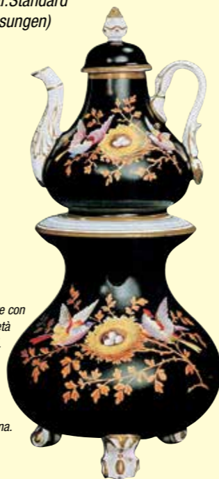
Lume da notte con tisaniera della metà del sec. XIX.

Oggetto che serviva per dare un tenue chiarore alla camera da letto e per tenere tiepida la tisana.