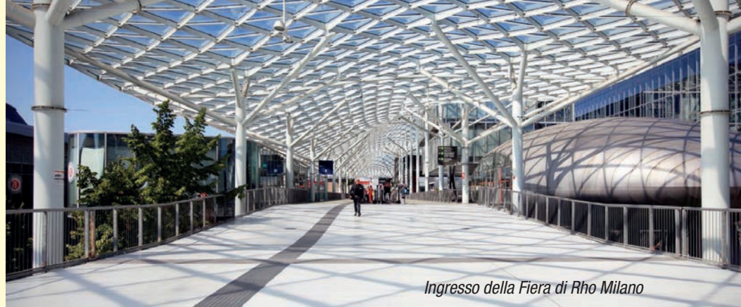
Ingresso della Fiera di Rho Milano

In tema di accordi, la nuova partnership con Filiera Italia e Coldiretti promuoverà