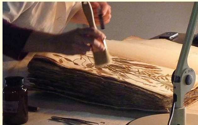
L'Herbarium Mediterraneum Panormitarum

Sarà possibile vedere esemplari unici di piante monumentali come il Ficus macrophylla subsp. columnaris C. Moore & F. Muell. presente nell'Orto Botanico di Palermo, primo introdotto in Europa e pianta vincitrice del concorso "Albero italiano 2022" promosso da Giant Trees Foundation e chiamato a rappresentare l'Italia al contest europeo #EuropeanTreeoftheYear 2023 e il bellissimo esemplare presente in piazza Marina. Si potranno ammirare le bellissime Dracaena draco