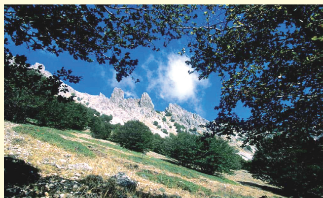
Parco delle Madonie