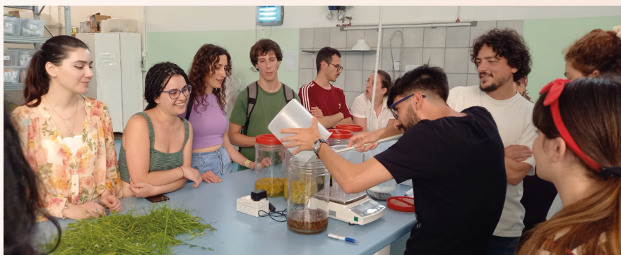
Nelle immagini di queste pagine, alcuni momenti degli incontri organizzati dall'Università di Pisa - Dipartimento di Farmacia con le aziende di settore.