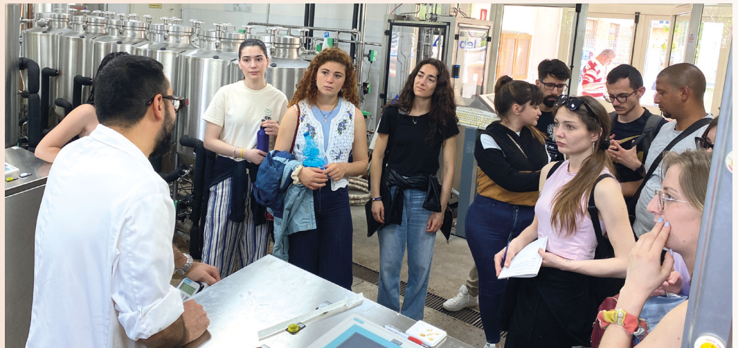
La visita al CERB - Centro di Ricerca per l'Eccellenza della Birra, nato in seno all'Università di Perugia e finalizzato alla ricerca nel campo della produzione, dello sviluppo e della certificazione qualitativa della birra.