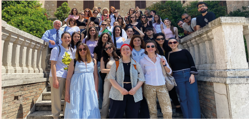
Inserita a sorpresa nel percorso dell'ultimo giorno di visite, la sosta alla Rocca di Casalina, gentilmente aperta e messa a disposizione dalla Fondazione per l'Istruzione Agraria e dall'Università di Perugia.