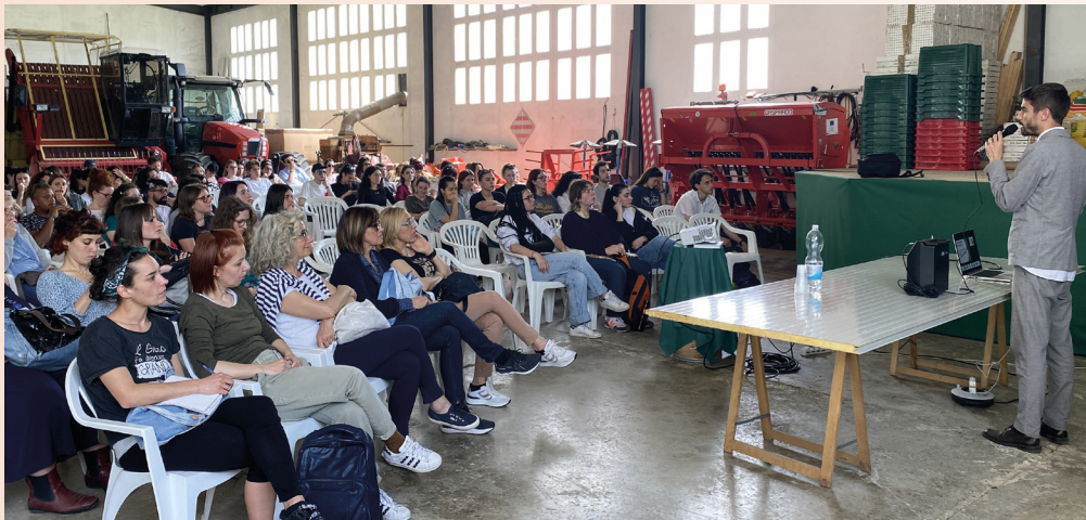
Presso l'azienda Biokyma, realtà italiana di qualità nella lavorazione delle piante officinali secondo i protocolli BIO, gli studenti hanno partecipato all'evento "La settimana delle Università", un momento di incontro fra gli studenti e l'operatività del mondo del lavoro