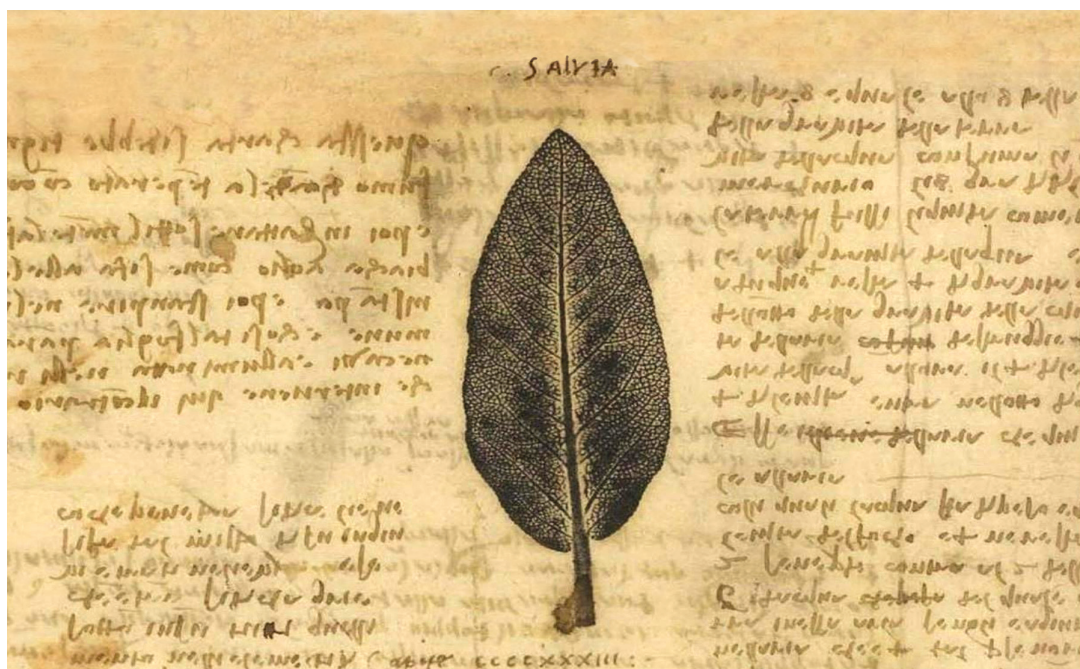
Leonardo Da Vinci. Illustrazione raffigurante una foglia di salvia e appunti scritti con la tradizionale calligrafia speculare leonardesca