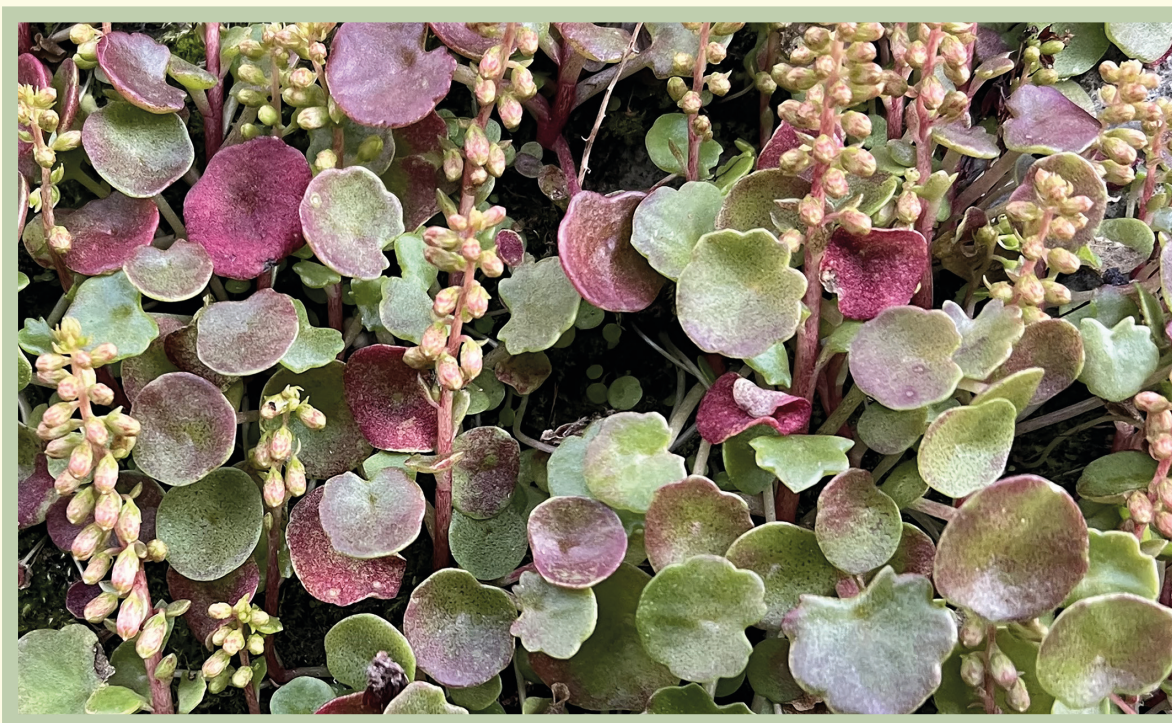
Le foglie circolari e concave.

* Giornalista e divulgatrice scientifico-naturalistica.