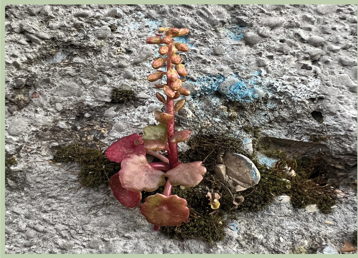
Esemplare su muro cittadino.