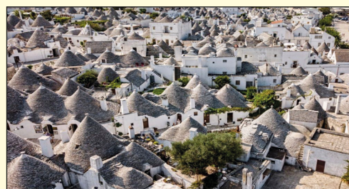
La sagoma tipica dei trulli di Alberobello