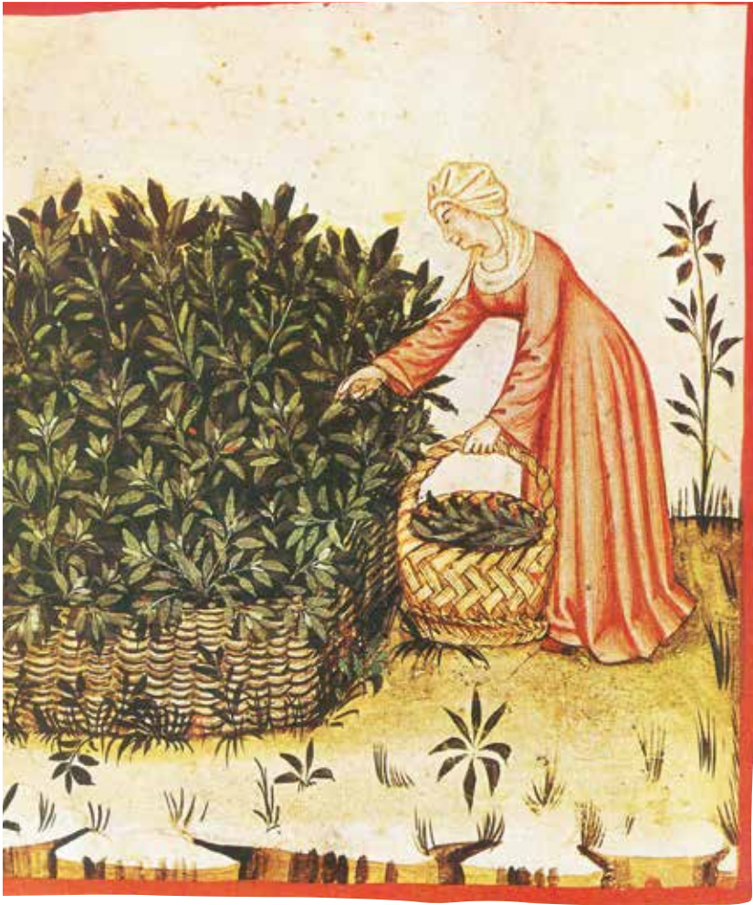
La salvia fu una delle piante medicinali più raccomandate dal Regimen Sanitatis Salernitanum (qui sopra, la raccolta della salvia nel Tacuinum Sanitatis di Liegi, sec. XII).