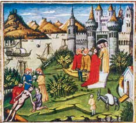
Frontespizio di una edizione in ebraico dei Canon di Avicenna raffigurante la città di Salerno, un vero e proprio centro di organizzazione della cultura che, particolarmente nel campo sanitario, si manifestò con la creazione della celebre Scuola Medica Salernitana.