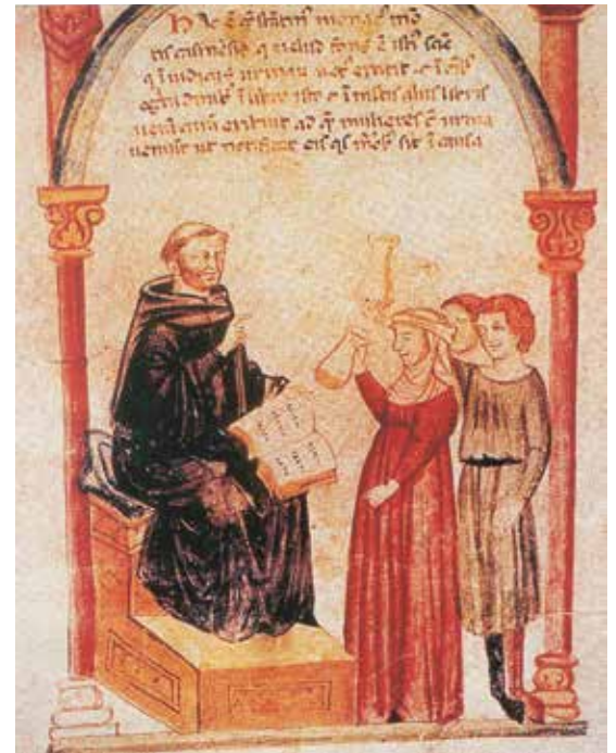
Pionieri di queste pratiche furono i monaci itineranti irlandesi e anglosassoni, specialmente dopo che le devastazioni barbariche si erano abbattute sull'Occidente.

parte ebbero nella storia dei medicinali provenienti dai monasteri e aprendo così la strada alle moderne tecniche farmaceutiche di estrazione di principi attivi dalle piante. Le loro spezierie si dotarono così di un tale armamentario di strumenti di lavoro da costituire oggi splendide testimonianze dello sviluppo costante dell'arte farmaceutica nei monasteri medioevali.