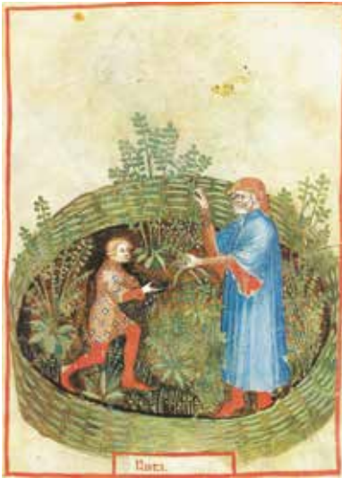
La ruta godeva anche nel Medioevo fama di pianta adatta a curare i dolori mestruali (dal Tacuinum Sanitatis della Biblioteca Nazionale di Parigi, sec. XIV).

conventi. Si tratta dei gigli, delle rose, della salvia, della ruta, dei gladioli e del finocchio.